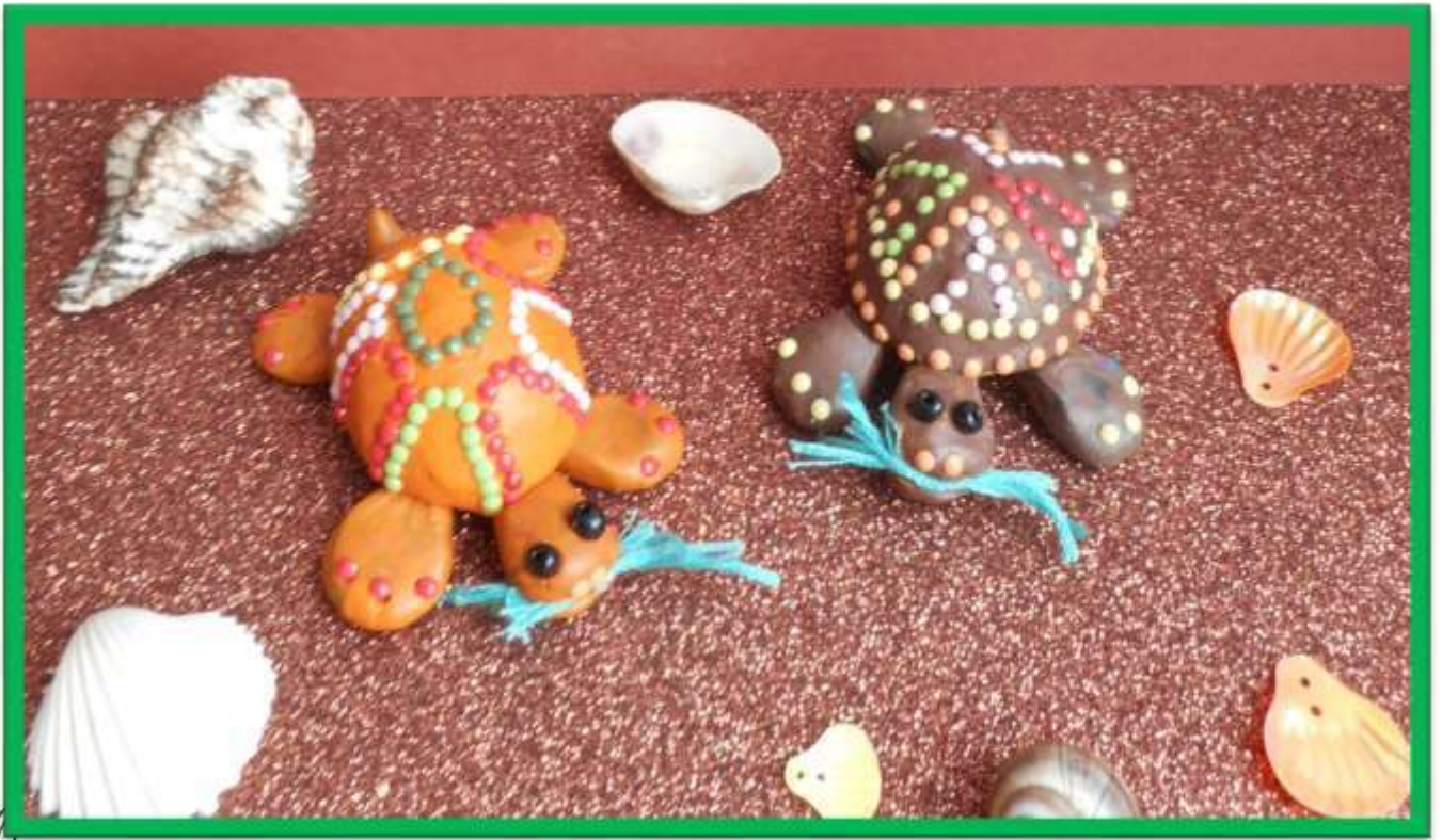
«Милашки – черепашки»