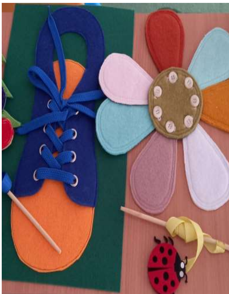
Шнуровки, липучки, пуговицы, застежки из фетра