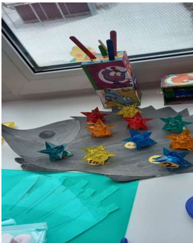
Колючий математический ежик.