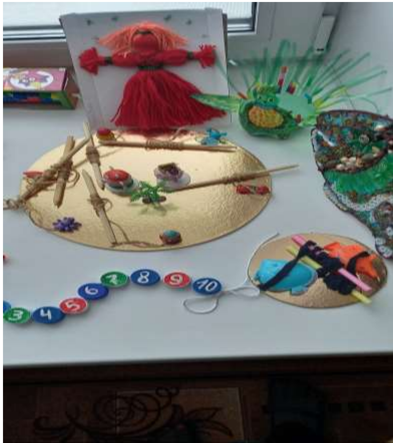
Математическая гусеница из крышек, дружеские «Маталочки», «Украсть хвост павлина»