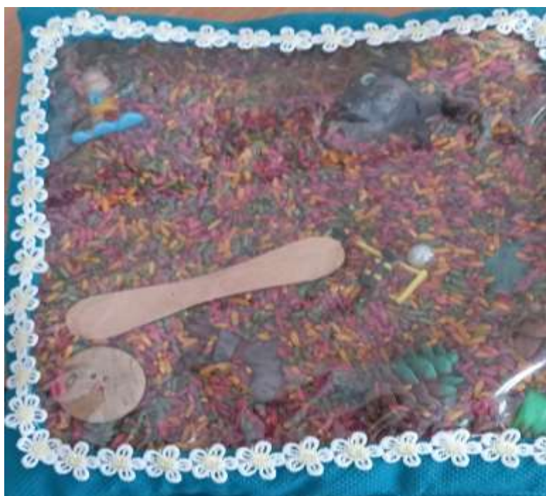
Тактильная подушечка, наполненная бросовым материалом.