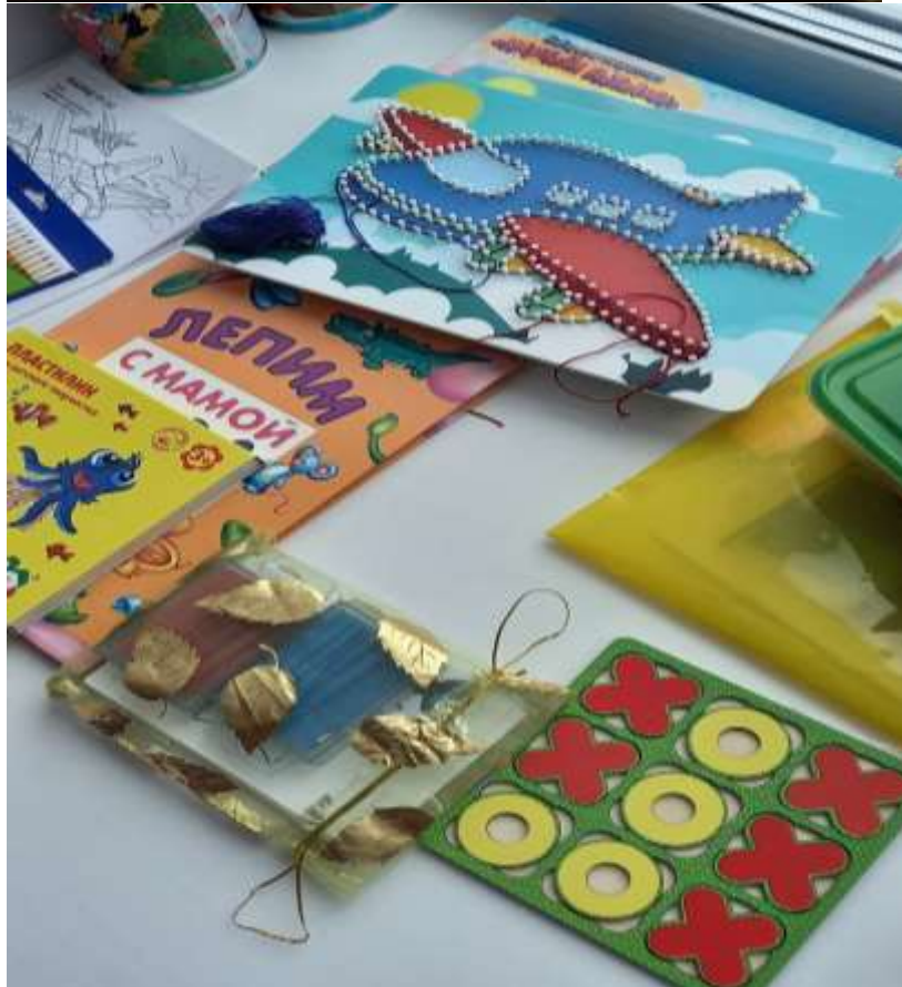
Деревянная игра «Крестики нолики», выкладывание различных схем из счетных палочек, картина нитками.