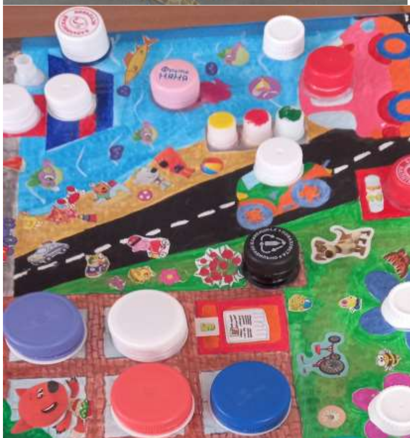
Настольная игра на развитие моторики, логики, внимания «По дороге с облаками» из крышек.