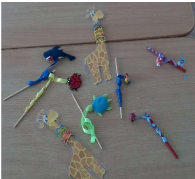
Маталочки, «Наряди жирафика»